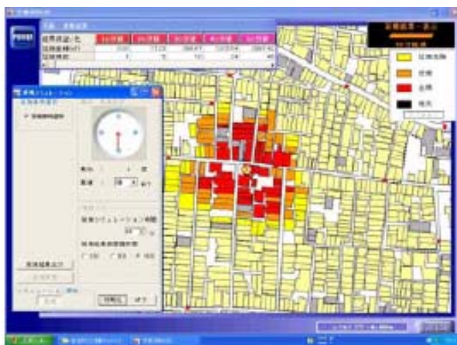
地震火災の延焼シミュレーション