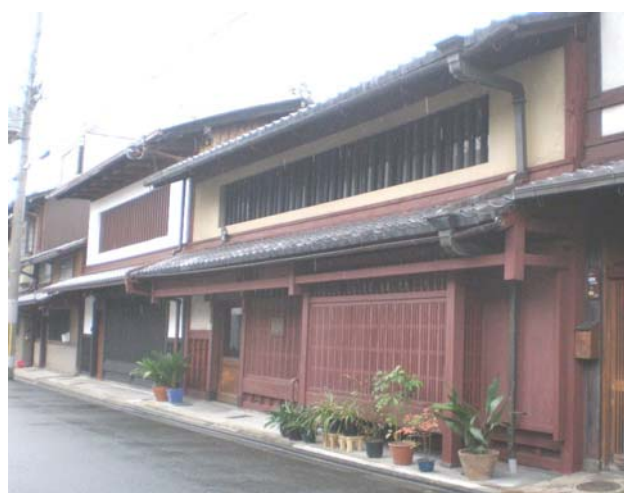
会場周辺の歴史的まちなみの例