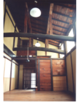
会場の土壁の町家 (日本で初めて実験で防火・耐震改修の有効性を検証した町家)